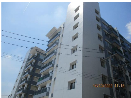
รูปที่ 1-1 สภาพโครงการในปัจจุบัน